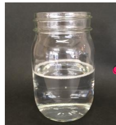
Before 洗剤を溶かした水