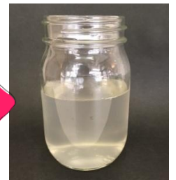
After 汚れが溶け出した水